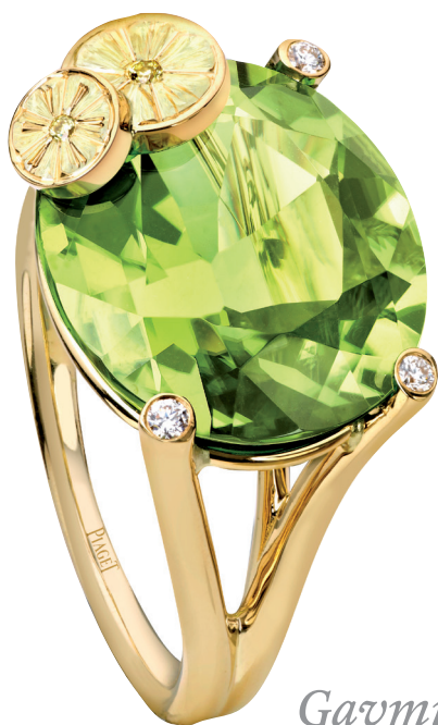
Fra Piagets Cocktail-kollektion – ringen "Tutti Green" af 18 karat guld med en ovaltsleben peridot på 10,98 carat, 3 brillanter (i alt ca. 0,04 carat) og to gule brillanter (i alt ca. 0,02 carat)